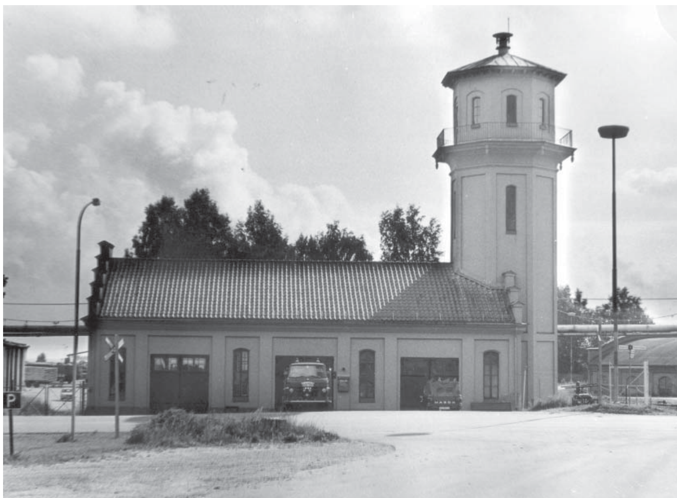
Brandstationen i Ljusne, okänt årtal.

G enom åren har vi fått många förslag på när denna byggnad blev uppförd. Vi har inget säkert svar. Kan någon det exakta året? Och i så fall bevisa det, exempelvis med någon slags dokumentation eller på annat sätt? Hör i så fall av er till oss på DiBiS i Ljusne eller Söderhamn.