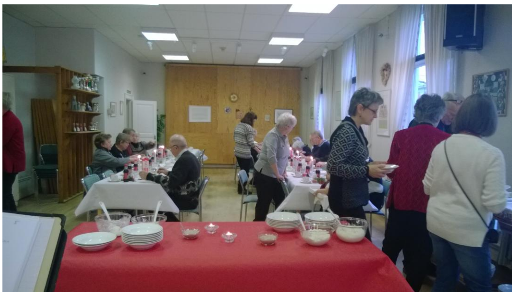
Julgröt på Vargen